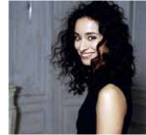
RACHIDA BRAKNI actrice, réalisatrice, scénariste