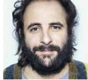
VINCENT MACAIGNE acteur, réalisateur, metteur en scène