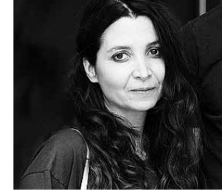
DANIELLE ARBID réalisatrice, scénariste, actrice