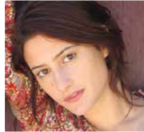
LOLA CRÉTON actrice