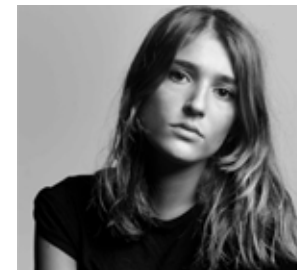
LOLA BESSIS réalisatrice, actrice